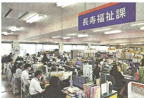
花巻市の長寿福祉課

2024年4月に政府が訪問介護基本報酬を2〜3%引き下げたことから、全国の訪問介護事業所は収入が減って経営難に