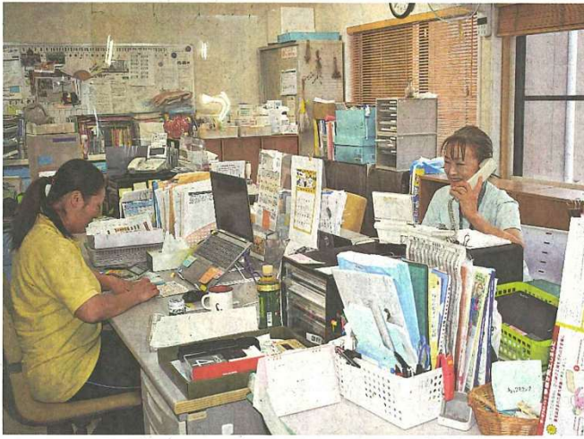
i k介護サービスのヘルパーステーション