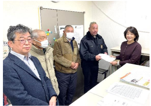
田中朝子議員を訪問する杉並社保協のメンバー

今回の採択は、杉並区の国保加入者にとどまらず、全国の国保加入者、さらには国民皆保険制度のもとで医療を受けるすべての人にとっても重要な前進となるものです。