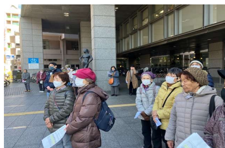
70人の区民が集会に参加、採択されるよう見守りました。