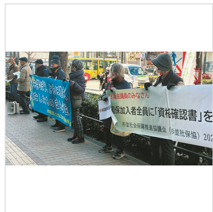
区議会での採決を前に、一律交付を求める市民たち＝東京・杉並区役所前