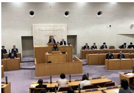
区議会で採択されました。