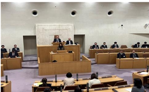
2026 年 1 月 14 日、区議会で採択されました。