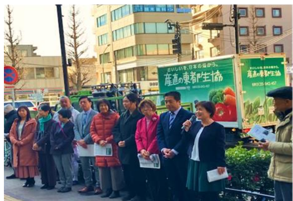
70 人の区民が集会に参加、採択されるよう見守りました