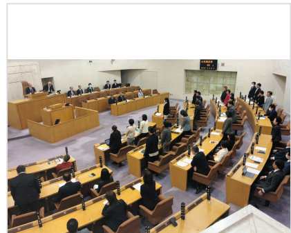
資格確認書に一律交付を求める陳情を採択した東京・杉並区議会

【関連記事】 カードじゃなくて「紙」が活躍中…健康保険の「資格確認書」大きすぎて困惑する人も なんでそうなった？