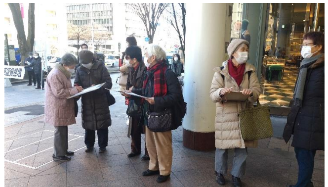
対話がどんどん広がって…