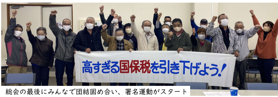
総会の最後にみんなで団結固め合い、署名運動がスタート

西村会長…税金の 負担はとも重い。安 心して商売と生活が できるよう、国保税 は払える税金にさ せましょう。