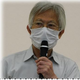
「継続した自治体キャラバンの取り組みについて」筑後地区社保協貫橋さん