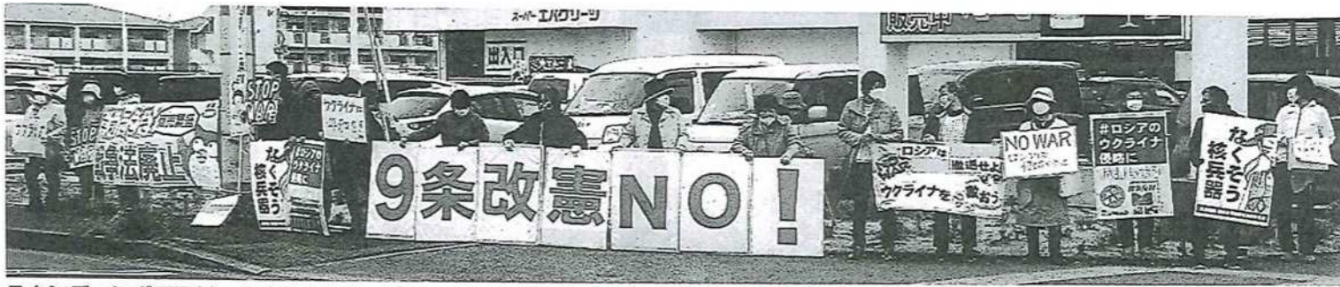
スタンディングでアピールする人たち=29日、大阪府泉南市

実施し、22人が参加しました。 「9条改憲NO!」「なくそう核兵器」「核兵器禁止条約に日本も参加を」「平和でこそ商売繁盛」「ウクライナへの侵略やめよ」「STOP WAR」などのプラカードや横断幕をかかげてアピールしました。 宣伝を見てわざわざ募金しに来る人、信号待ちや買い物帰りに募金する人が何人もいました。