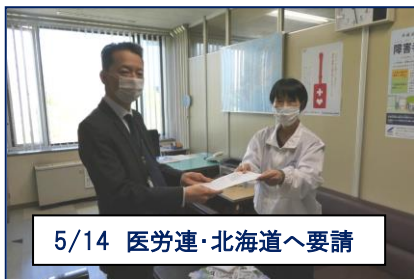
5/14 医労連・北海道へ要請

多くの団体が、新型コロナウイルス感染症対策の強化を求めて、北海道や道議会各派に要請してきました。第2回北海道議会(6月16日～7月3日)では、こうした道民の世論と運動を反映し、この間の新型コロナウイルス感染症に対する学校一斉休校などの知事の判断、休業協力・感染リスク低減支援金などの道の施策やその進捗、今後の取り組みなどについて論議され、知事提案の補正予算に対する予算特別委員会での附帯意見や国への意見書が採択されました。