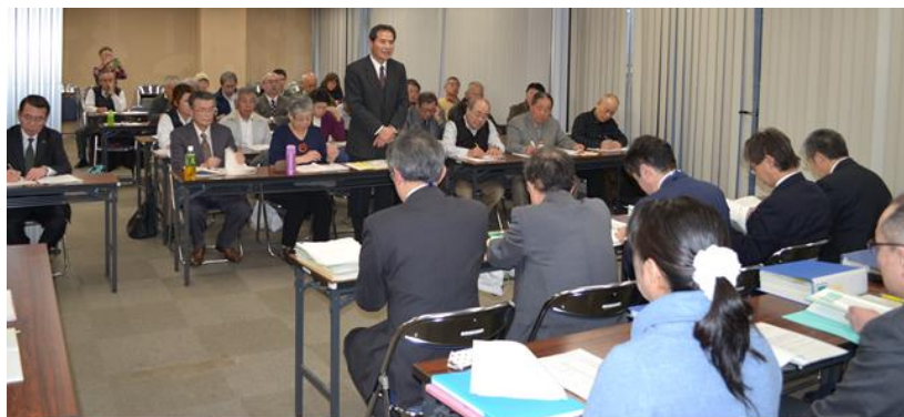
「医師・看護師を増やし、地域医療と介護の提供体制の充実」を要請↑

第1に「地域医療構想の各医療圏域での検討・計画づくり」、第2に「保健医療計画見直しによる県立病院のあり方」、第3に「改定介護保険事業支援計画での地域包括ケア、市町村に押し付けられた介護予防事業」などを中心に懇談しました。