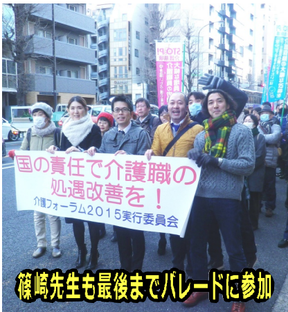
篠崎先生も最後までパレードに参加

集会の最後に、「介護・障害福祉従事者の人材確保のための処遇改善と、医療・介護総合法の実施中止を求めるために、共同した運動を大きく発展させよう」の集会アピールを全体で確認しました。